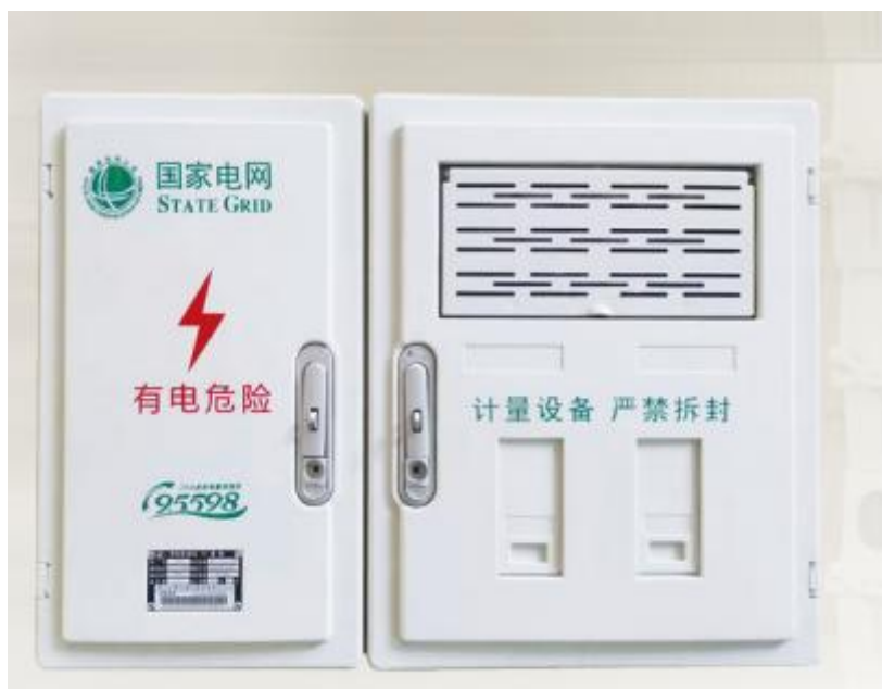
电能计量箱（配电板）（PXD2）