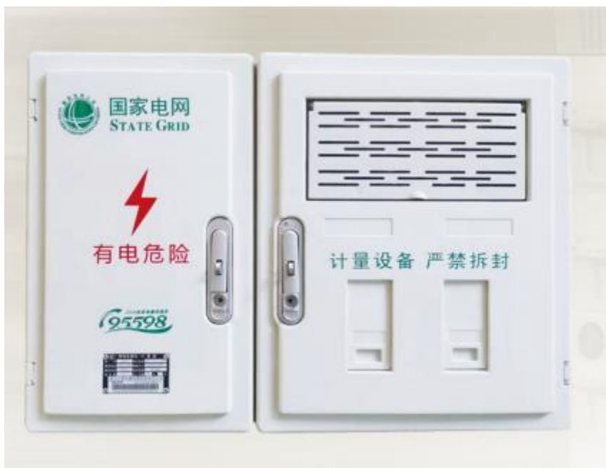
电能计量箱（配电板）（SXD2）