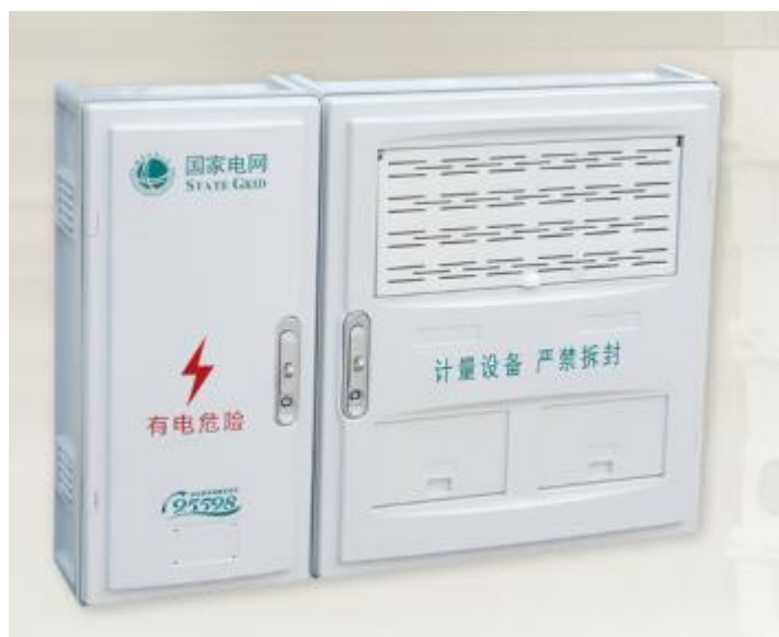
电能计量箱（配电板）（PXS2）