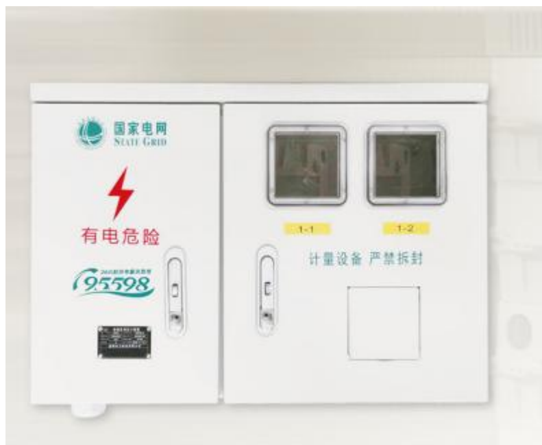
电能计量箱（配电板）（BXD2）