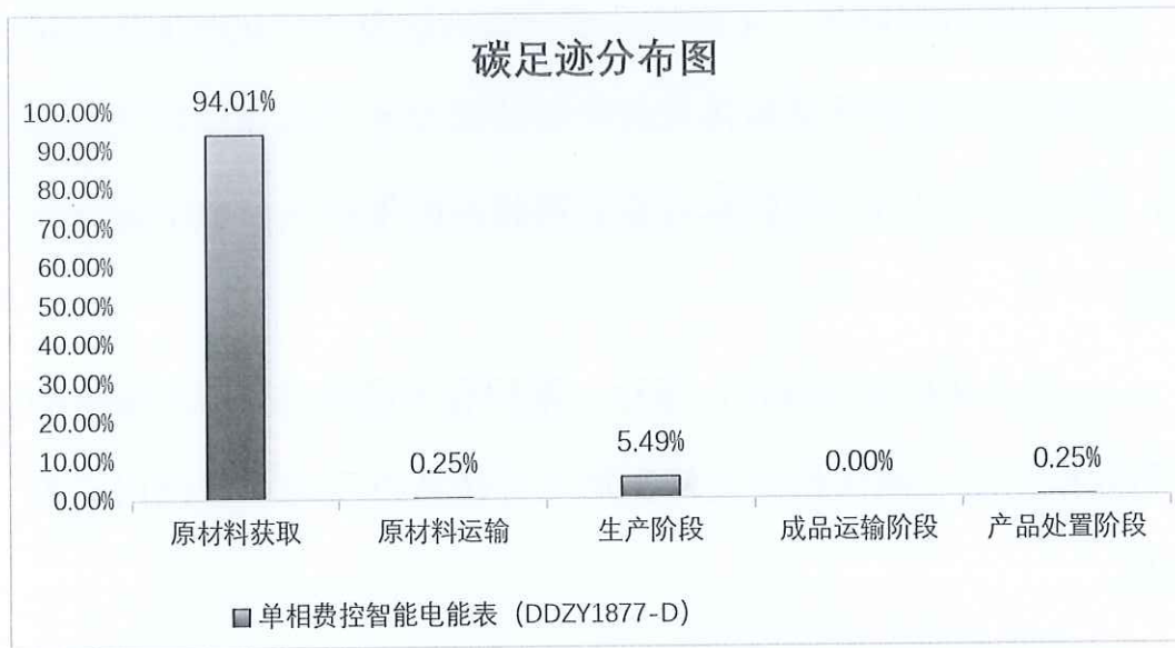
图 5.2.1.2 单相费控智能电能表 (DDZY1877-D) 生命周期阶段碳排放分布图