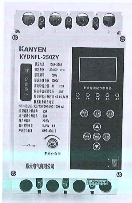
剩余电流动作断路器（KYDNFL-250ZY）