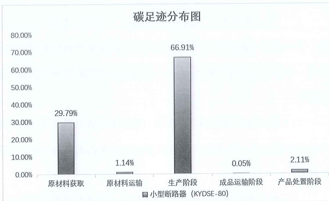
图 5.2.1.2 小型断路器 (KYDSE-80) 生命周期阶段碳排放分布图