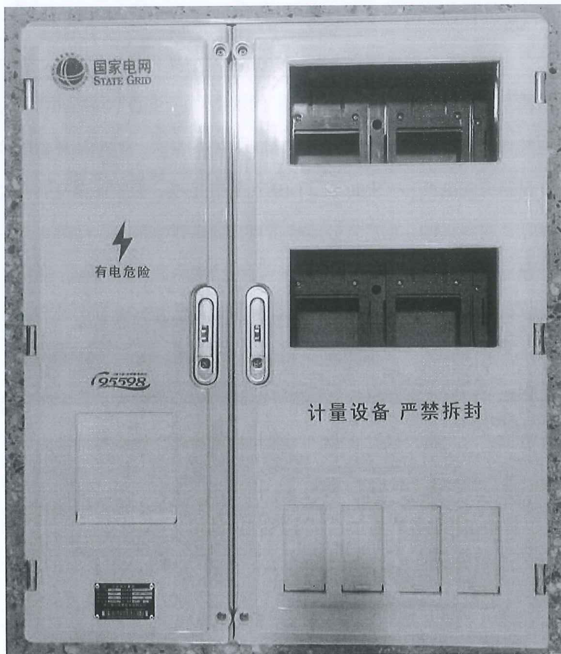
电能计量箱（配电板）（SMC）（DBX）