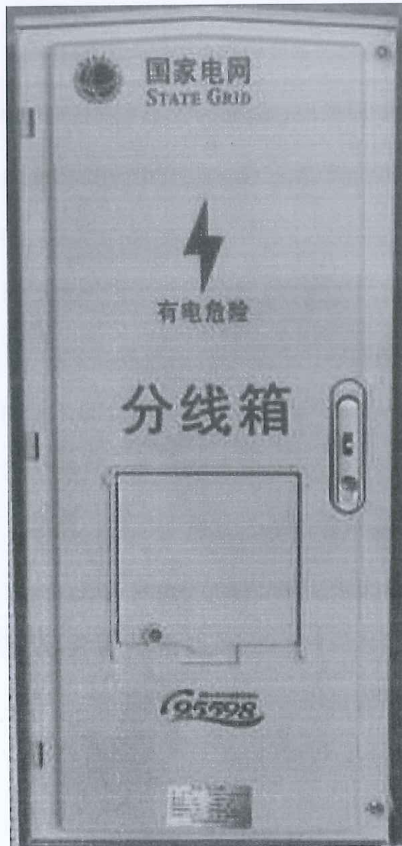
配电箱（低压分线箱）（FXX）