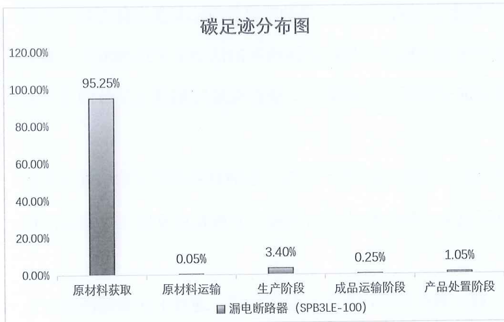
图 5.2.1.2 漏电断路器 (SPB3LE-100) 生命周期阶段碳排放分布图