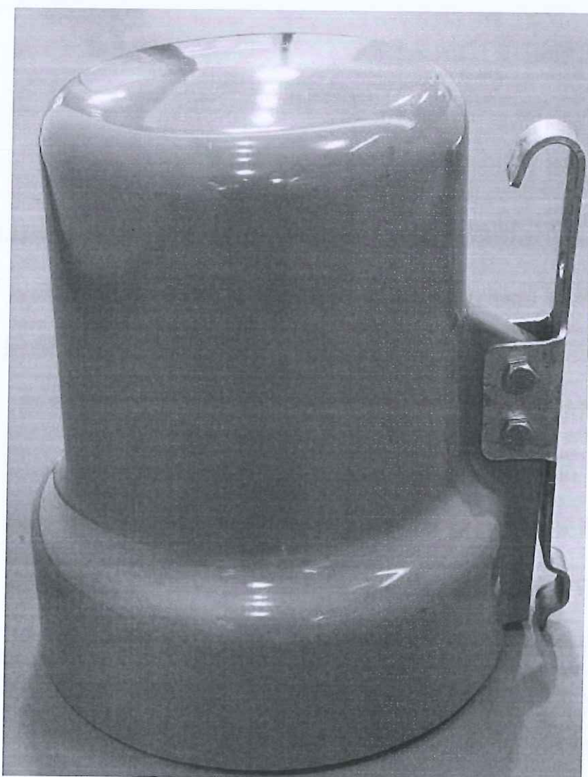
配电自动化馈线终端 (TGF-200)