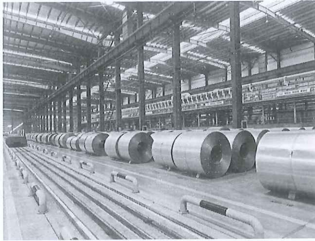
热浸镀锌铝镁合金镀层钢板