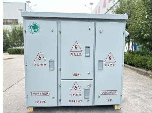
低压综合配电箱：JP 型