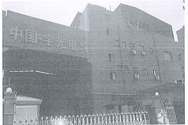
乐清经济技术开发区纬五路 189 号