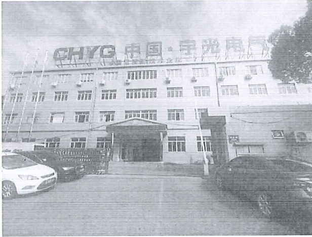
城南街道界岱工业区

电线、电缆经营；电力行业高效节能技术研发；太阳能发电技术服务；软件开发；信息技术咨询服务；技术服务、技术开发、技术咨询、技术交流、技术转让、技术推广；非居住房地产租赁；货物进出口；技术进出口（除依法须经批准的项目外，凭营业执照依法自主开展经营活动）。许可项目：发电业务、输电业务、供（配）电业务；输电、供电、受电电力设施的安装、维修和试验；建设工程施工；施工专业作业（依法须经批准的项目，经相关部门批准后方可开展经营活动，具体经营项目以审批结果为准）。（分支机构经营场所设在：乐清市乐清经济开发区纬五路 189 号（浙江科棋电气有限公司内））。宇光电气有限公司目前的经营状态为存续。