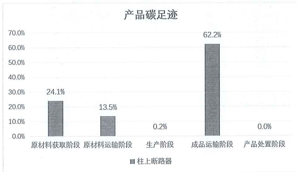
图 5.2-2 生命周期阶段碳排放分布图