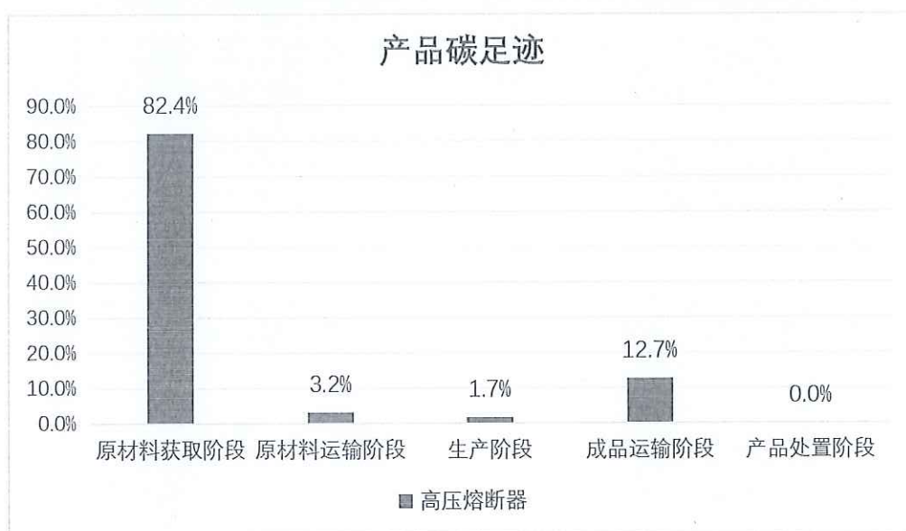
图 5.2-2 生命周期阶段碳排放分布图