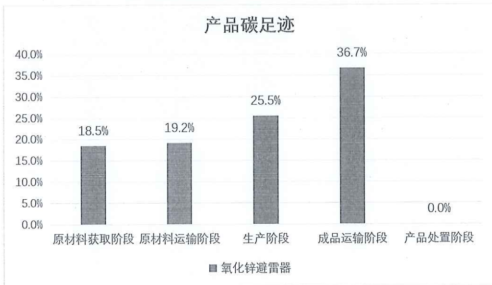
图 5.2-2 生命周期阶段碳排放分布图