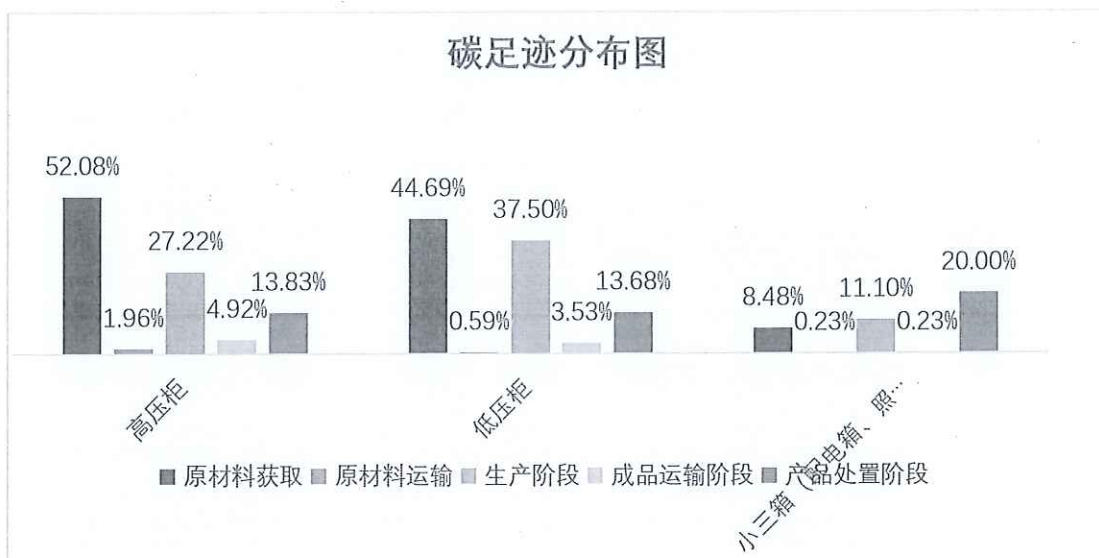
图 5.2-2 生命周期阶段碳排放分布图