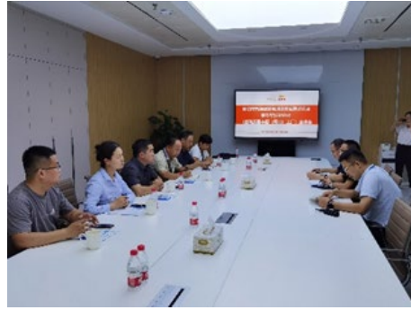
企业质量提升帮扶活动